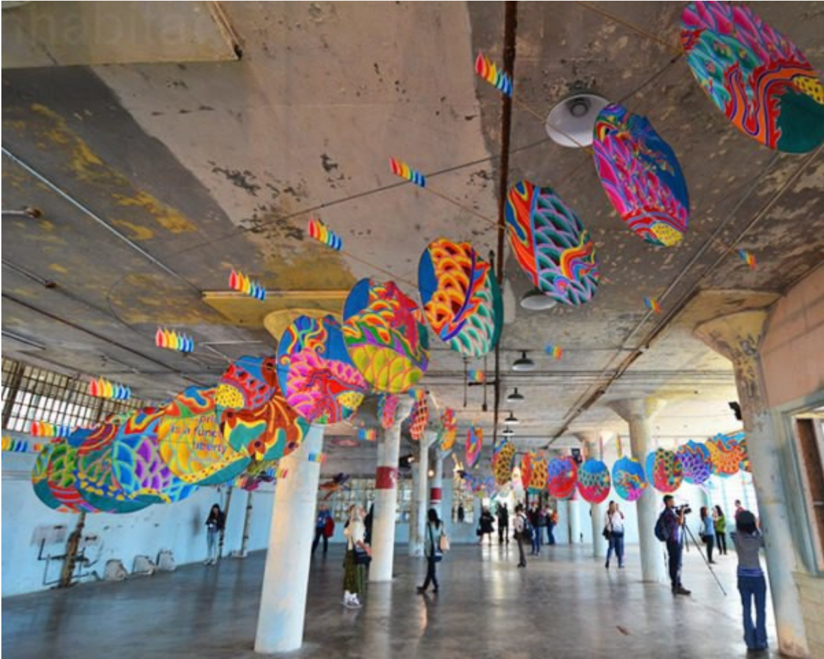
Ai Weiwei Unveils Colorful Chinese Dragon for With Wind