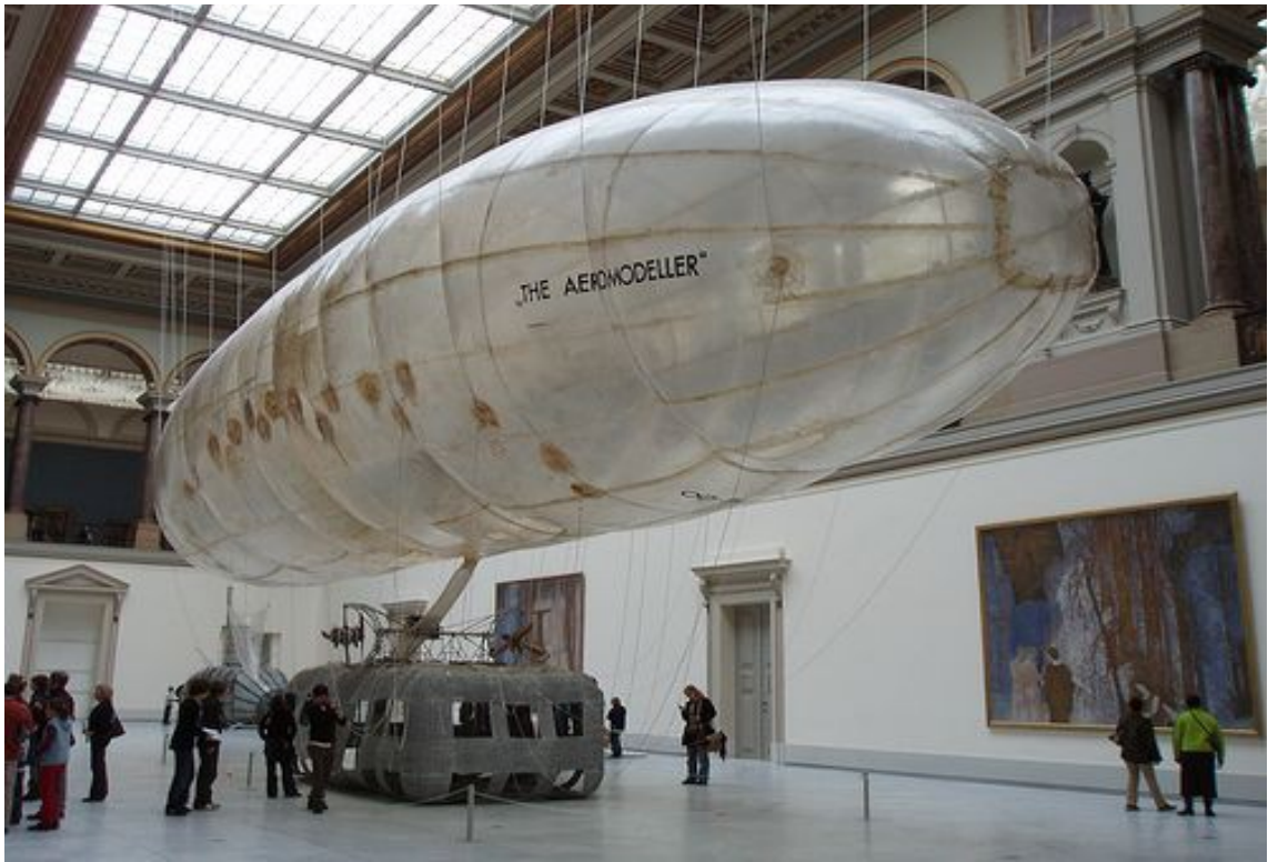
Panamarenko, « aeromodeller »