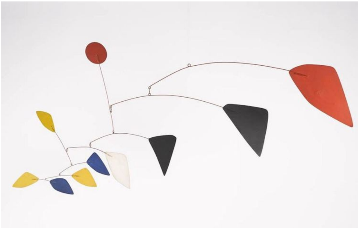
Iconic 1960 Calder

Après ce confinement long et lourd, je vous propose un peu de légèreté, de souffle, de vent, de danse. Comme la citation ci-dessus à partir de petites choses récupérées ça et là, cintres en acier, baguettes de bois, petits objets découpés dans du carton... fil... Vous devrez réaliser un mobile, un cerf volant, ou un n'importe quel objet susceptible de prendre le vent d'être animé par un souffle. En tout cas d'être « mobile » en suspension dans l'espace.